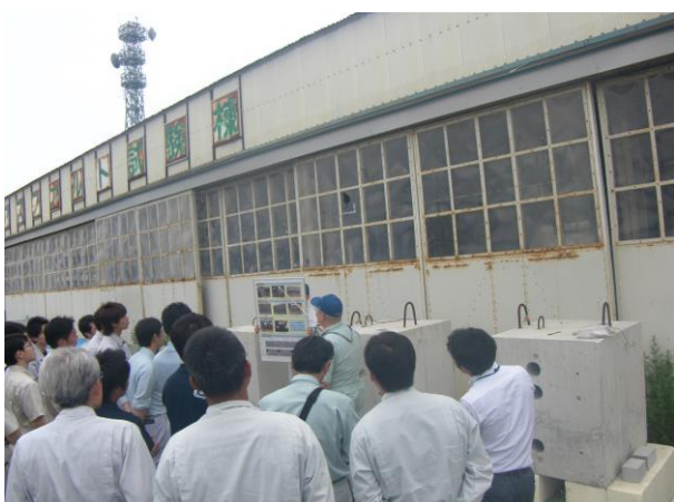
EE東北見学及び 体験型土木構造物実習施設研修