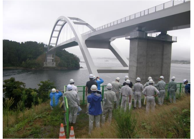
県・市町村技術職員現場研修